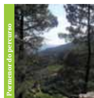
Pormenor do percurso

A maior altitude, a Rota de Vale de Amoreira revela belíssimas panorâmicas sobre a paisagem humanizada rural, com uma vista sobre densas florestas e terrenos de produção agrícola localizados no flanco da encosta – Quintas do Vale .