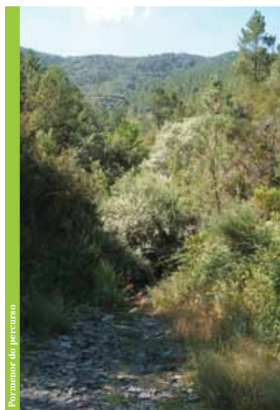
Pormenor do percurso

Estas áreas florestais, juntamente com matos e linhas de água, proporcionam diversidade florística e faunística, podendo-se observar espécies como morcego-de-ferradura-pequeno e o morcego-de-ferradura-grande que enfrentam risco de extinção elevado. Neste percurso estão ainda presentes o tartaranhão-caçador , o coelho bravo , o corvo , o mocho-de-orelhas e o toirão , entre outros.