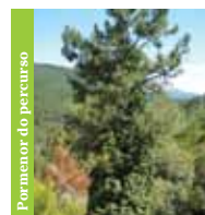
Pormenor do percurso