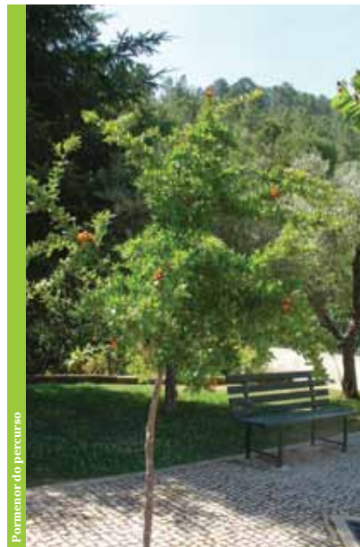
Pormenor do percurso

A Rota de Vale de Amoreira é fortemente marcada pela influência humana, permitindo aos caminheiros explorar o património natural, cultural e paisagístico da freguesia.