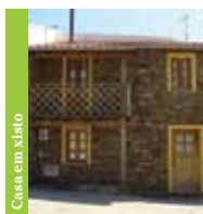
Casa em xisto