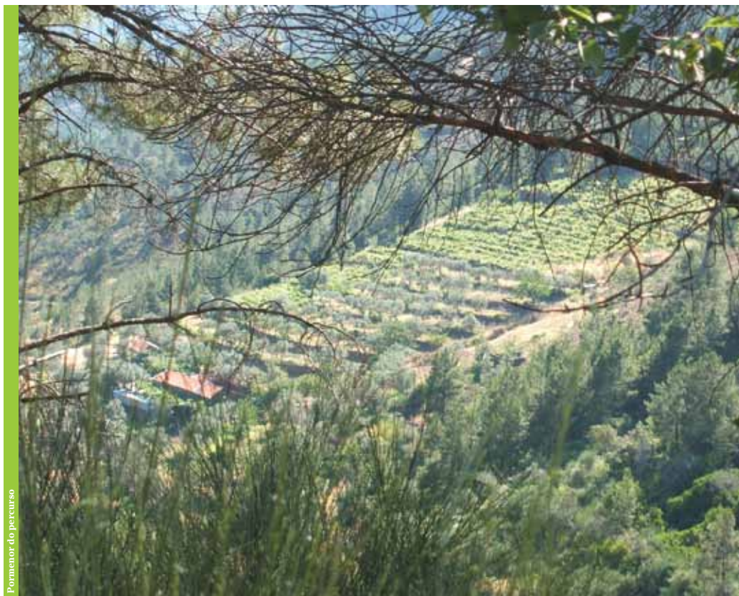
Pormenor do percurso

A extraordinária diversidade cromática e morfológica do percurso é conferida, entre outros factores, pela variedade da vegetação. Merece especial destaque o povoamento de pinheiro bravo que surge, na região, como a exploração silvícola por excelência, suportando as mais diversas condições climáticas e pedológicas.